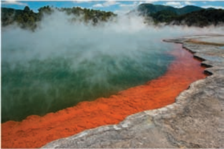
Champagne Pool, Wai-O-Tapu thermal wonderland / New Zealand

Voor stap 1, het beperken van de energievraag zijn een aantal mogelijkheden, het eenvoudigste is het voorkomen van tocht door fatsoenlijke kierdichting van ramen en deuren, het isoleren van de buitenschil met name het dak.