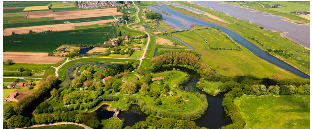
Stelling van Honswijk

Ook de Raad voor Cultuur en de Raad voor leefomgeving en infrastructuur adviseren om meer verbindingen te leggen tussen erfgoed en de veranderingen in onze leefomgeving. Dit vraagt om betrokkenheid van erfgoedorganisaties en om het leggen van verbindingen. Het kabinet heeft hiertoe al een stap gezet door, samen met 26 andere partijen, de Green Deal Participatie van de omgeving bij energieprojecten te ondertekenen. Deze deal heeft als doel inwoners van een gebied en belanghebbenden te betrekken bij onder meer zonne- en windenergie. 10 Opgedane kennis en ervaring uit de Visie Erfgoed en Ruimte over erfgoed, participatie en inpassing worden daarbij actief gedeeld en benut.